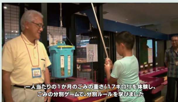
一人当たりの1か月のごみの重さ(17キログラム)を体験し、ごみの分別ゲームで、分別ルールを学びました