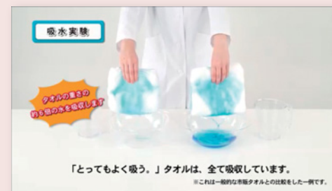
タオルの吸水量を比較する実験

実験やインタビューを加えることで説得力が増し、ご覧になった方の購買意欲や参加意識のアップにつながります。素材としてはスチール(写真)の活用も有効です。写真をつなげて動画風に加工しテロップをつければ、撮影コストを抑えつつ伝えたいことを効果的にまとめられます。